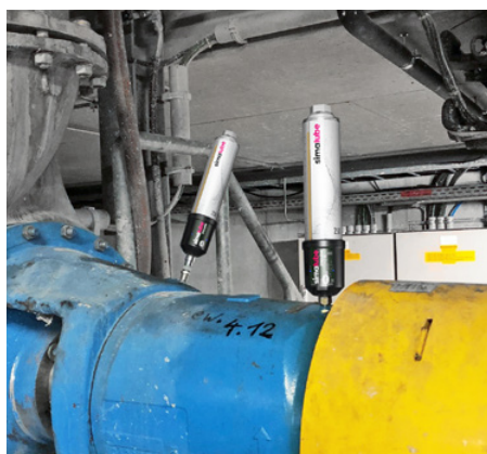
I cuscinetti della pompa sono lubrificati con due IMPULSE e simalube 250 ml.