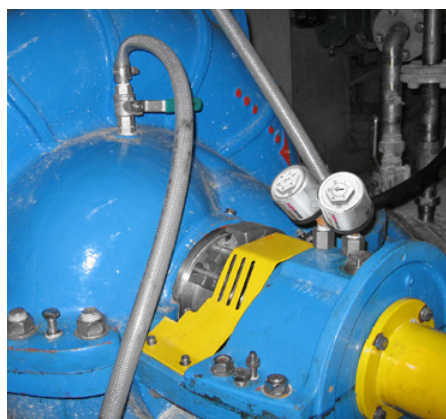
Due simalube 30 ml lubrificano il cuscinetto di una pompa.