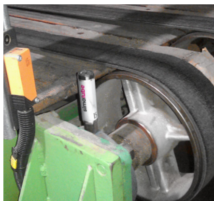
I cuscinetti dei nastri di trasporto in una fabbrica di cartone ondulato sono costantemente lubrificati con il lubrificatore simalube.