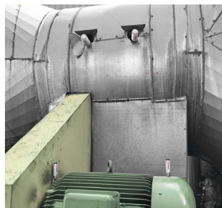
Lubrificazione dei cuscinetti in un impianto di aerazione con simalube 125 ml e 15 ml.