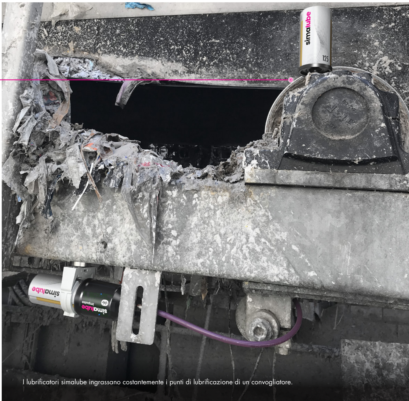
I lubrificatori simalube ingrassano costantemente i punti di lubrificazione di un convogliatore.