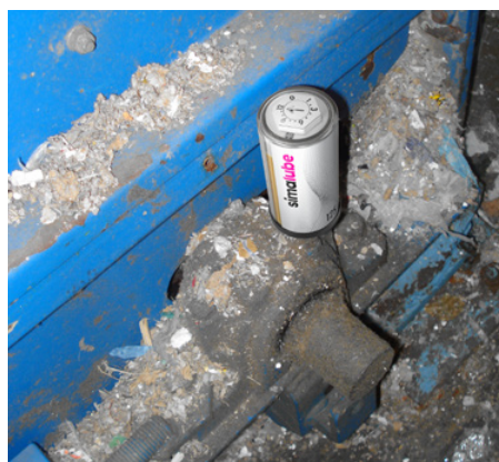
In una cartiera il cuscinetto di supporto di un tritatore è lubrificato con simalube 125 ml.

«Notevole risparmio di tempo e sensibile miglioramento della sicurezza sul lavoro grazie alla lubrificazione automatica»