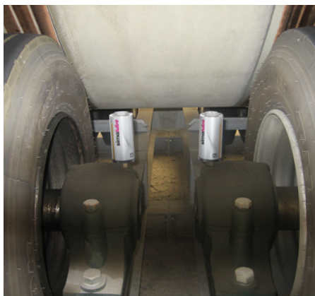
Cuscinetto verticale su un nastro trasportatore. I lubrificatori sono collegati direttamente al cuscinetto.