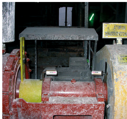
Lubrificazione dei cuscinetti sull'albero motore principale di una pompa.