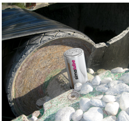
Nastro lubrificato con simalube.

«simalube riduce i costi e aumenta la sicurezza sul luogo di lavoro »