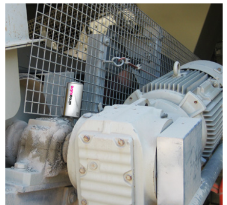
Cuscinetto verticale lubrificato su un nastro trasportatore