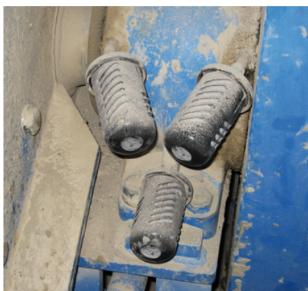
Calotte di protezione utilizzate per evitare danni al lubrificatore causati da difficili condizioni esterne.