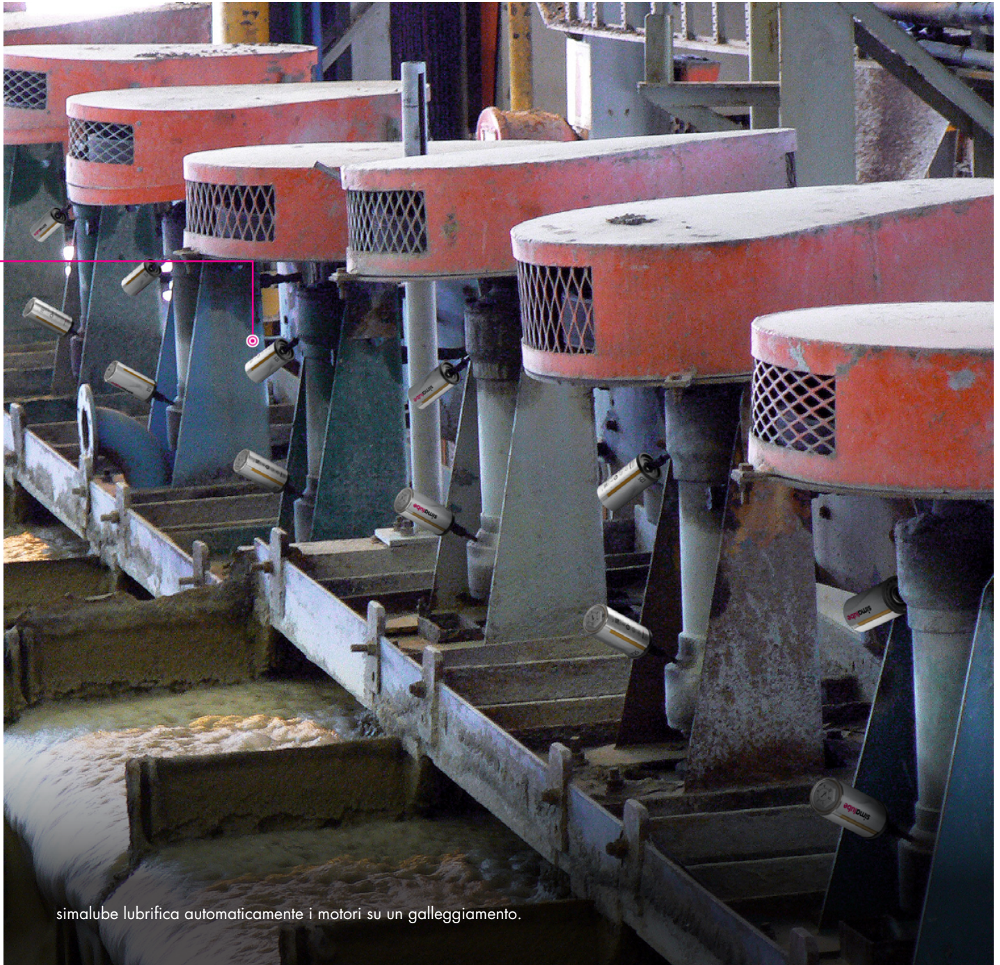
simalube lubrifica automaticamente i motori su un galleggiamento.