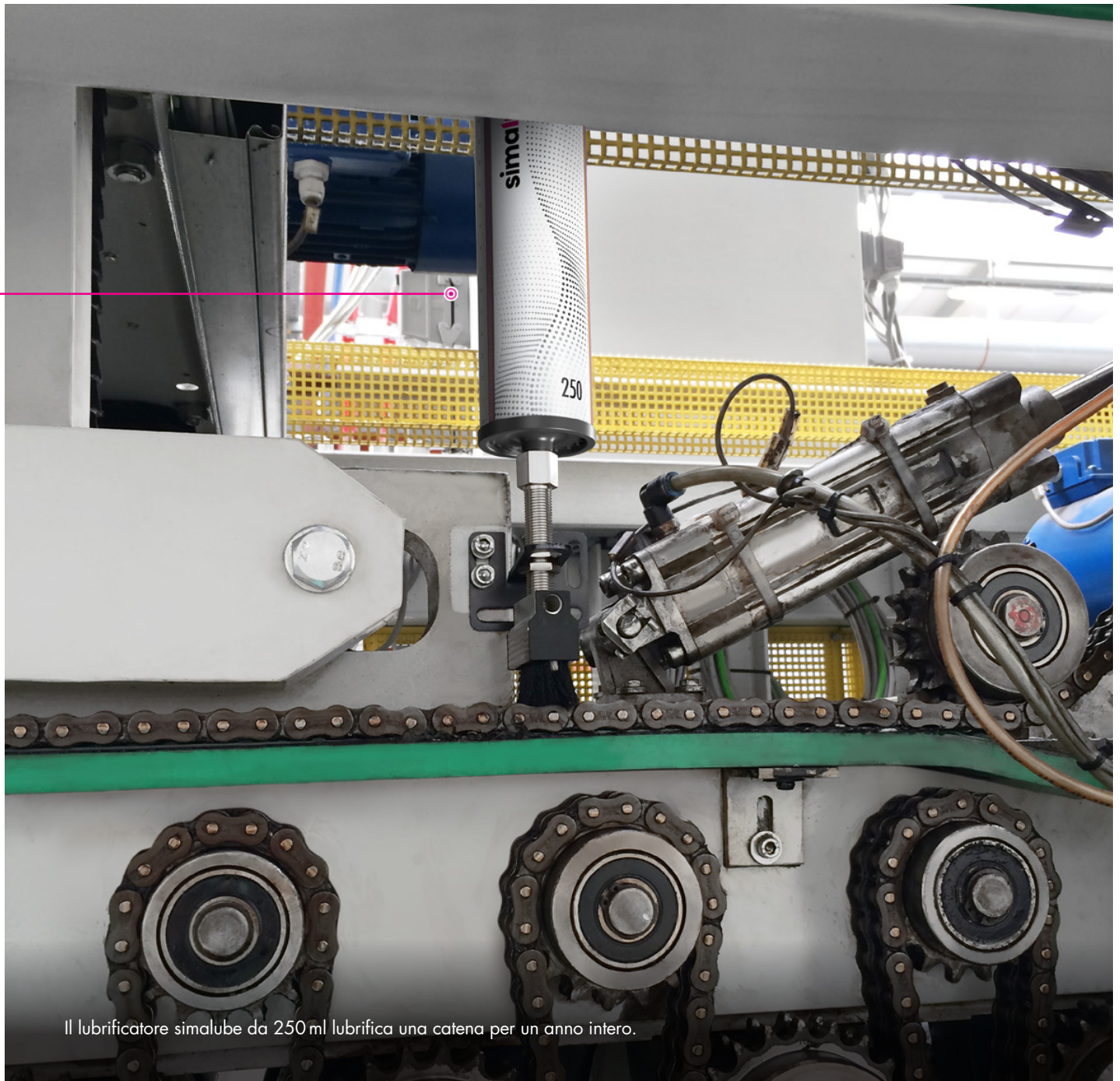
Il lubrificatore simalube da 250ml lubrifica una catena per un anno intero.