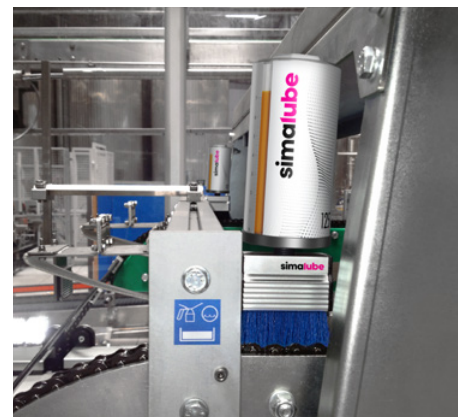
simalube dotato di spazzola lubrifica la catena in un birrifico.