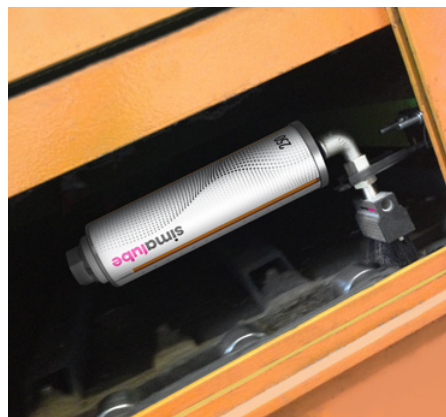
La catena di un nastro trasportatore in un impianto di riciclaggio viene automaticamente lubrificata e pulita con simalube dotato di spazzola.