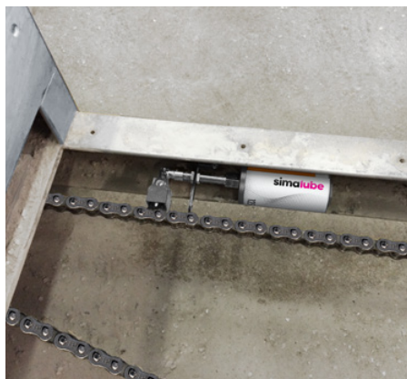
Se lo spazio disponibile è ristretto, simalube può anche essere installato in un angolo.